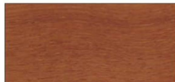
UV naturale (su legno di Teak)